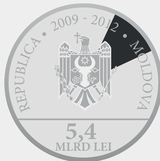
Guvernul SUA 11,306%