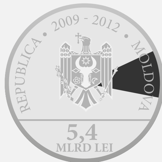
Banca Europeană de Investiții 10,066%