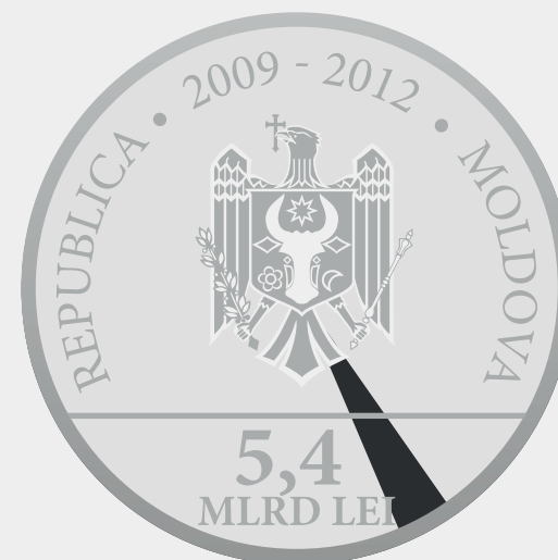
Banca Europeană pentru Reconstrucție și Dezvoltare 3,242%