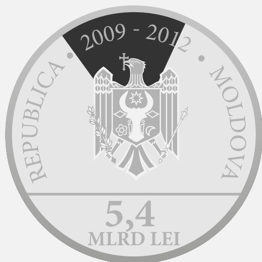
Comisia Europeană 16,796%