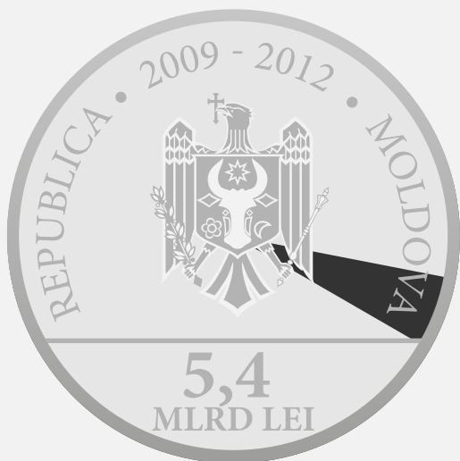
Fondul Internațional pentru Dezvoltarea Agricolă 5,020%