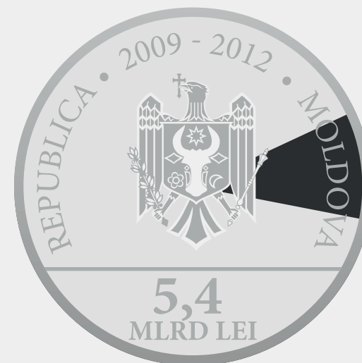
Banca Europeană de Investiții 10,066%