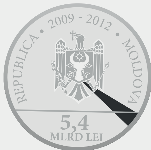
Fondul Global pentru Combaterea SIDA, Tuberculozei și Malariei 3,792%