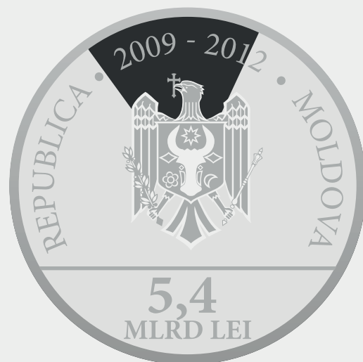
Comisia Europeană 16,796%