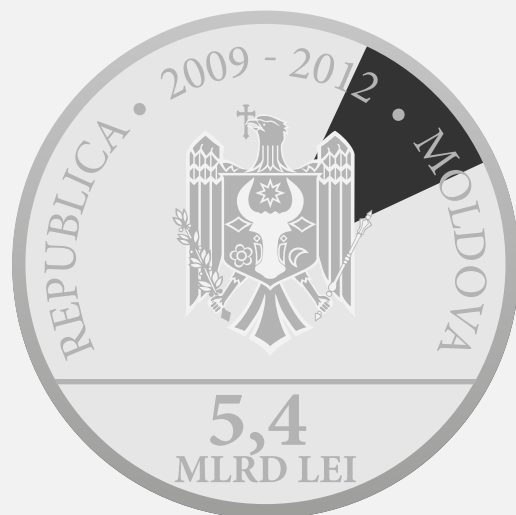
Guvernul SUA 11,306%