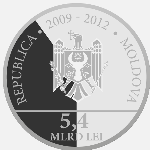
Banca Mondială 40,147%