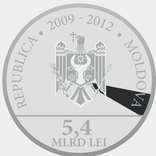
Fondul Internațional pentru Dezvoltarea Agricolă 5,020%