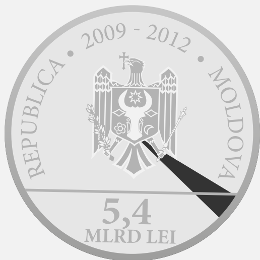
Fondul Global pentru Combaterea SIDA, Tuberculozei și Malariei 3,792%