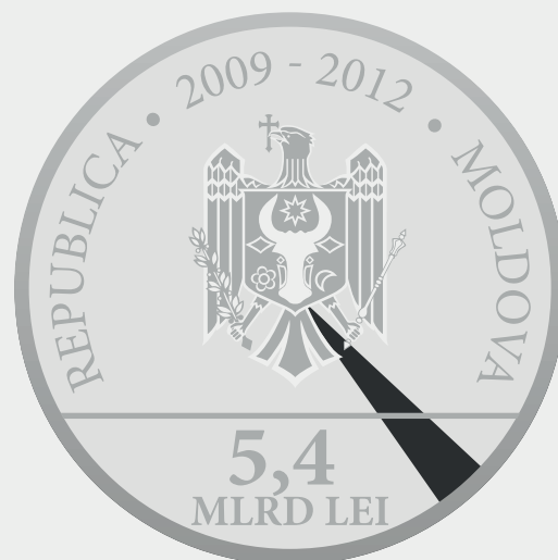
Banca de Dezvoltare a Consiliului Europei 3,395%