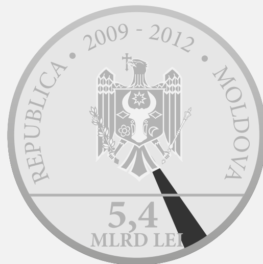
Banca Europeană pentru Reconstrucție și Dezvoltare 3,242%