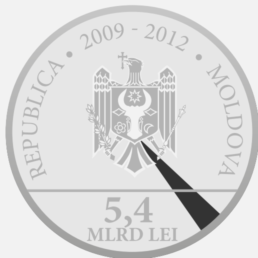
Banca de Dezvoltare a Consiliului Europei 3,395%